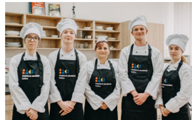
Hotelová akadémia, Južná trieda 10, 040 01 Košice

Veľká vďaka patrí našim župným školám za prípravu jedál a obzvlášť nášmu Gemerskému osvetovému stredisku v Rožňave za čerpanie inšpirácií pri výbere receptov.