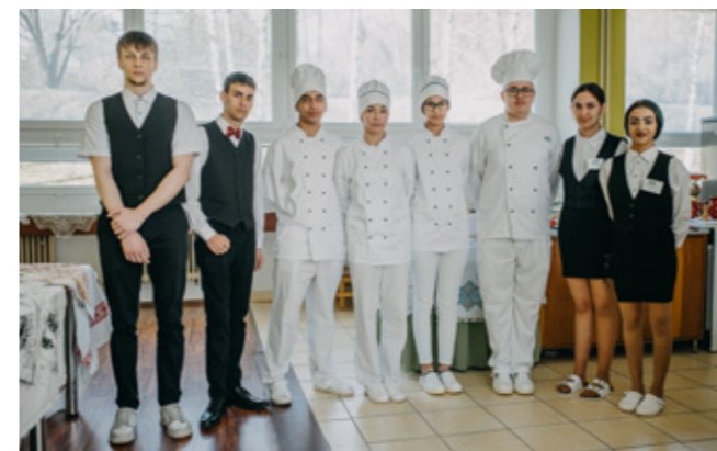
Stredná odborná škola obchodu a služieb, Rožňavská Baňa 211, 048 01 Rožňava