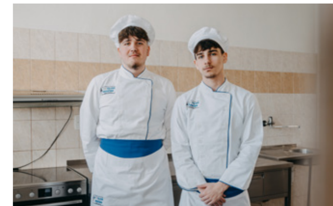
Hotelová akadémia, Radničné námestie 1, Spišská Nová Ves