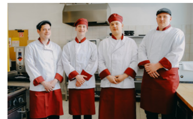
Stredná odborná škola obchodu a služieb Jána Bocatia, Bocatiova 1, Košice